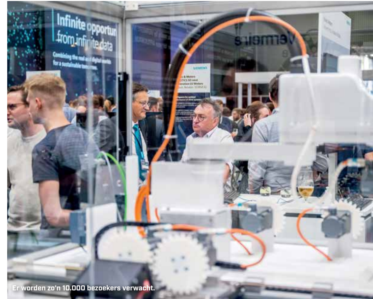
Er worden zo'n 10.000 bezoekers verwacht.