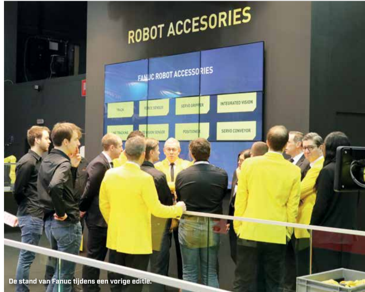
De stand van Fanuc tijdens een vorige editie.